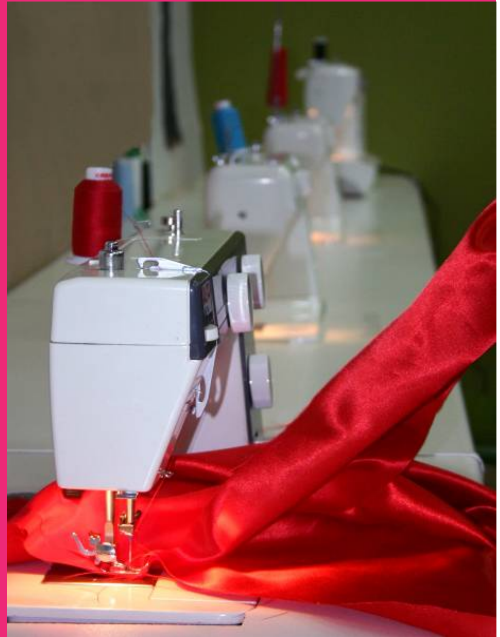
Confección de un vestido.