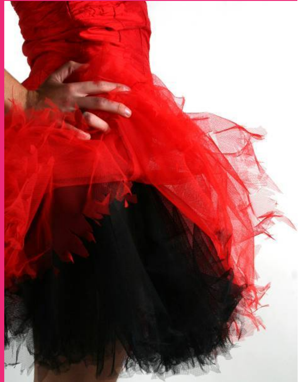
Diseño para un proyecto final