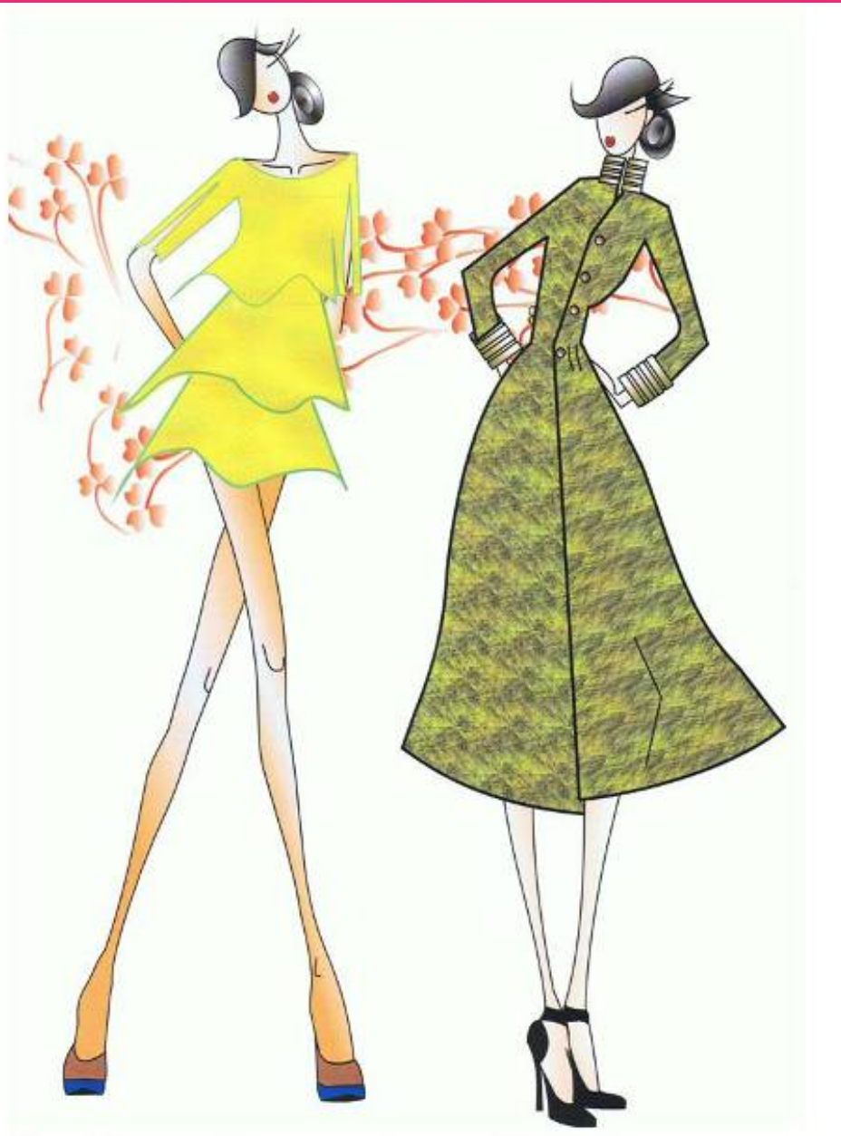
Dibujo mediante ordenador.