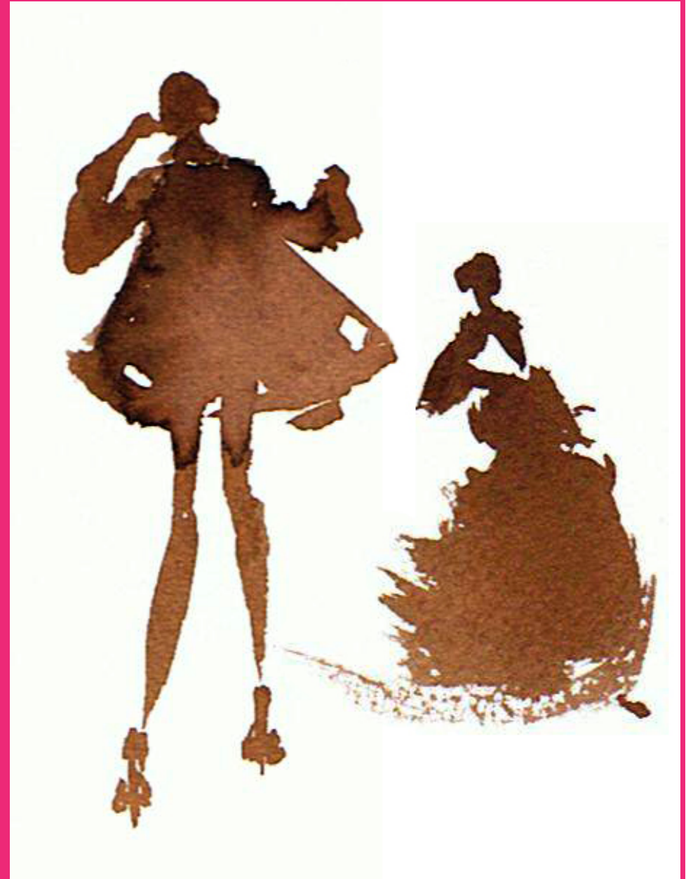
Dibujo realizado con tintas.