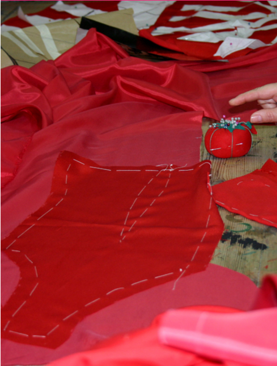
Patronaje y corte de un vestido.