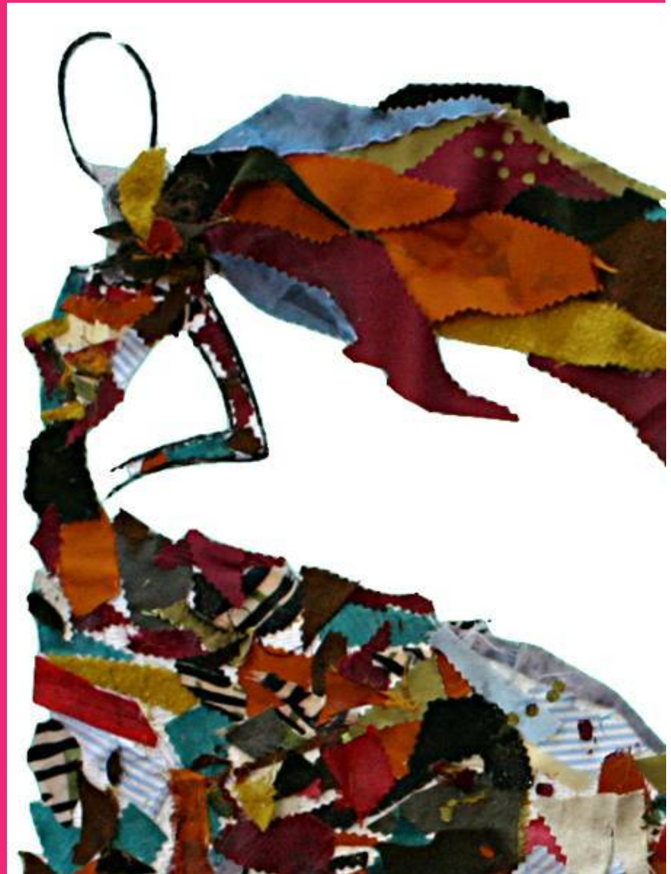
Figurín con tejidos.

También gracias a este ciclo podrás tener acceso a la universidad.